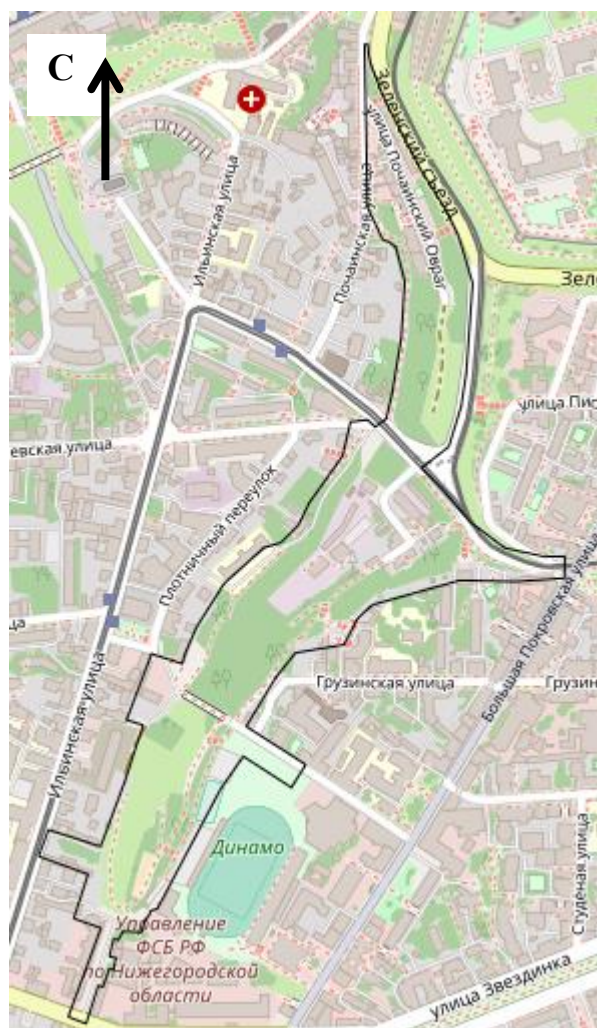
Схема границ подготовки документации по планировке (проект планировки и межевания) территории (арх. № 69/22)